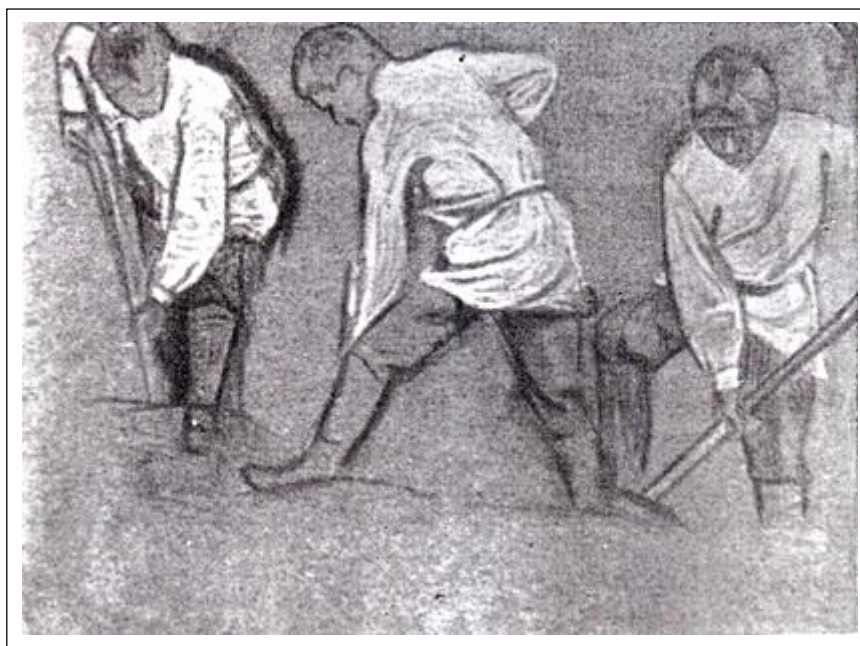
Н.К. Рерих. Землекопы. (На раскопках). 1890-е.